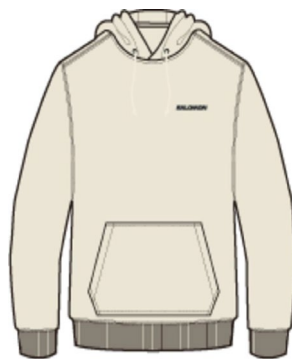
LC2249600 VANILLA ICE