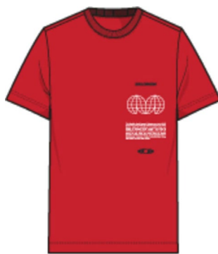
LC2249400 HIGH RISK RED