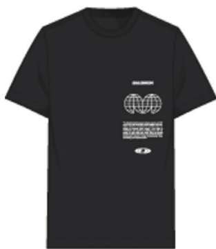
LC2249000 DEEP BLACK