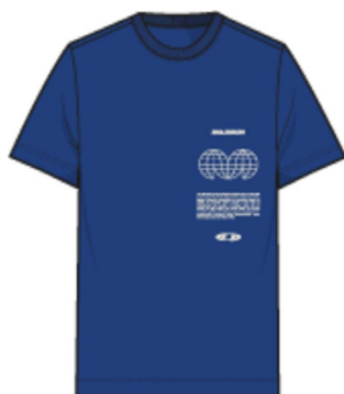
LC2249200 Surf The Web