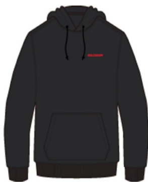
LC2249500 DEEP BLACK